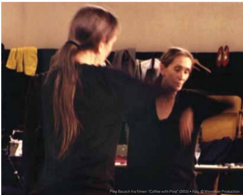
Pina Bausch fra filmen 'Coffee with Pina' (2003) • Foto: © Wenders Productions