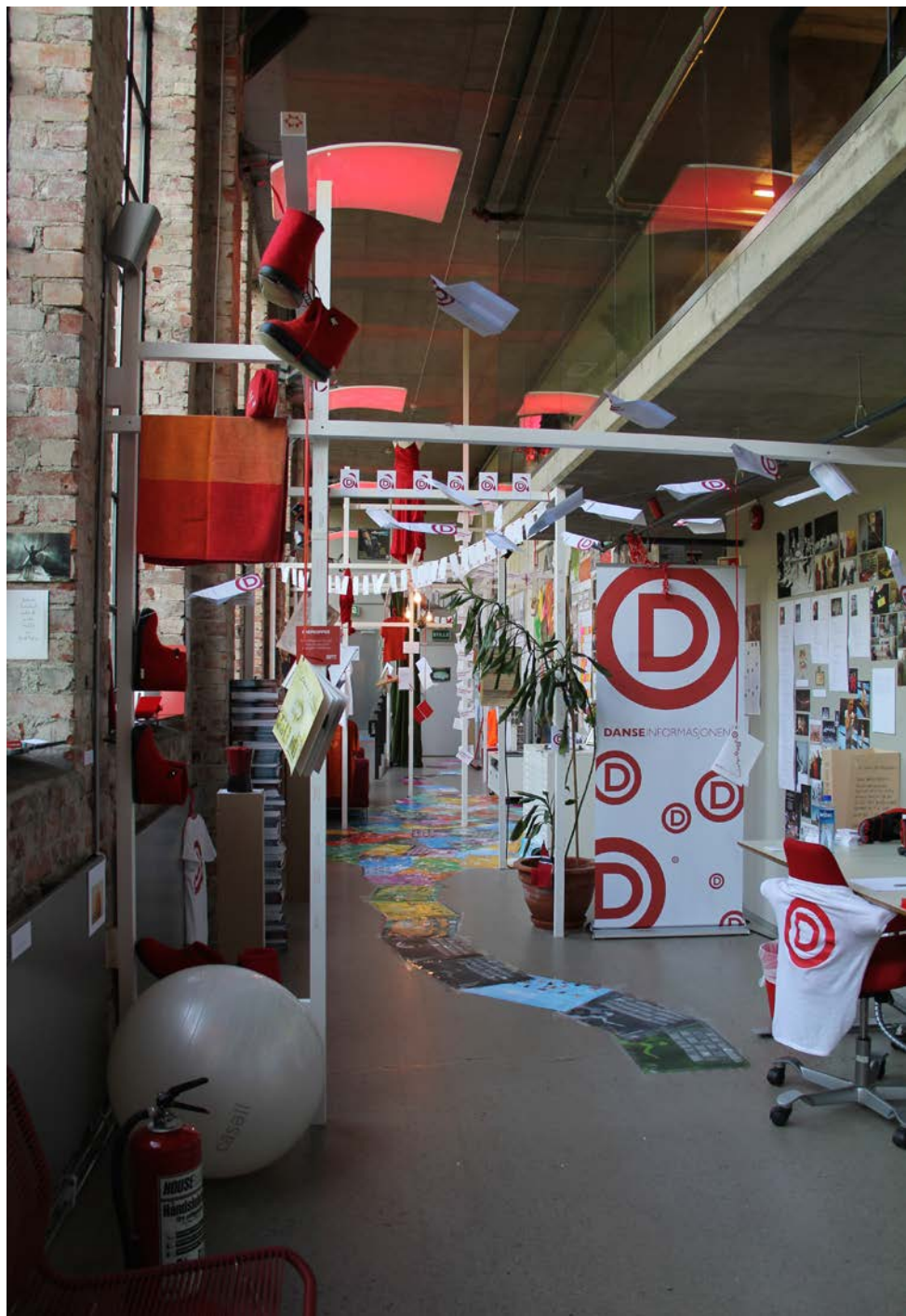
BILDE FRA EN UTSTILLING : Senter for Dansekunst & Danseinformasjonen - Biography