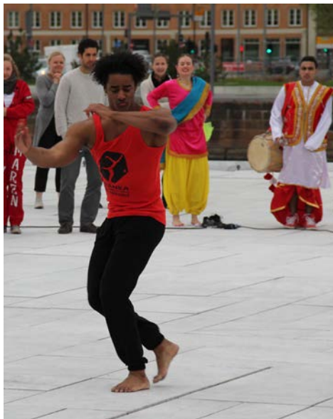
DANSENS DAGER: TABANKA - PÅ OPERATAKET

Dansens Dager 2014 ble støttet av Oslo kommune. Øvrige samarbeidspartnere for feiringen var de nasjonale organisasjonene Landslaget Fysisk Fostring i skolen, Trivselslederne og Dansens Hus.