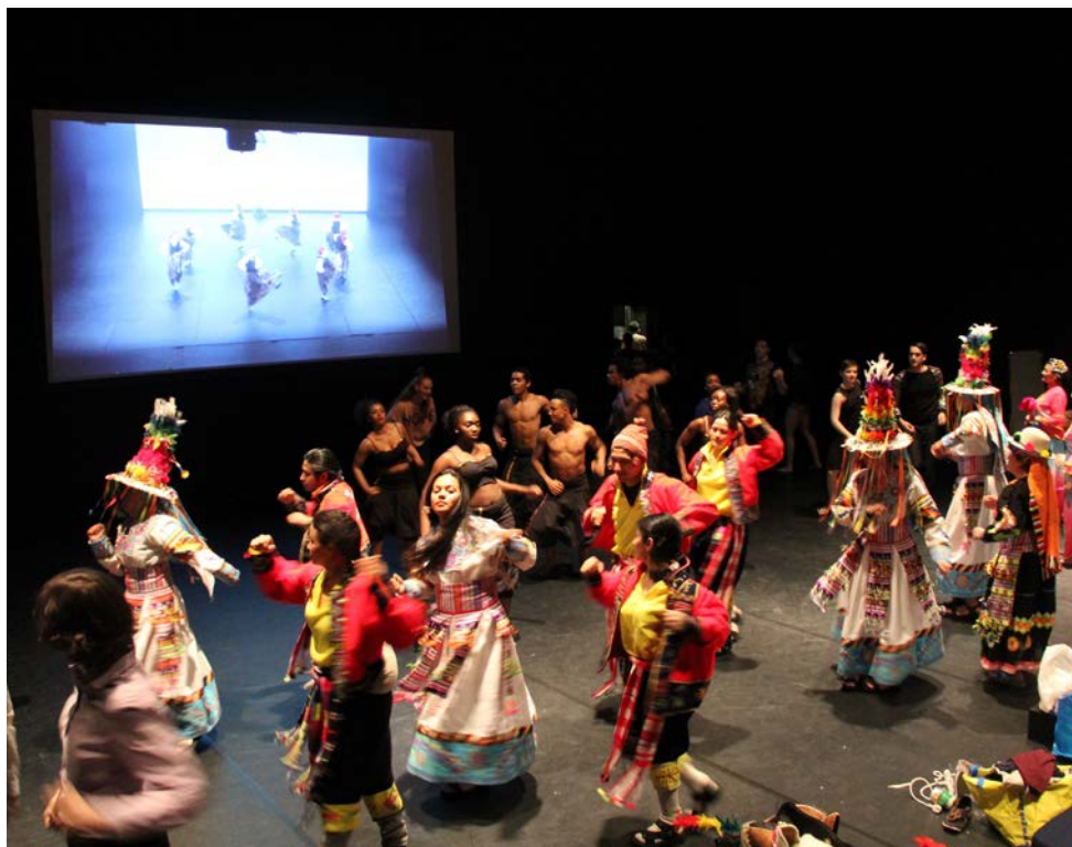
DANSENS DAGER: ÅPEN SCENE - BACKSTAGE UNDER FORESTILLINGEN