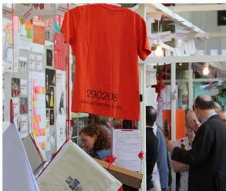
BILDE FRA EN UTSTILLING : Senter for Dansekunst & Danseinformasjonen - Biography

Det siste, og kanskje det viktigste som ble gjort i jubileumsåret, var lansering av 42 av Dansearkivets intervjuer på nett. Se Dansearkivet.