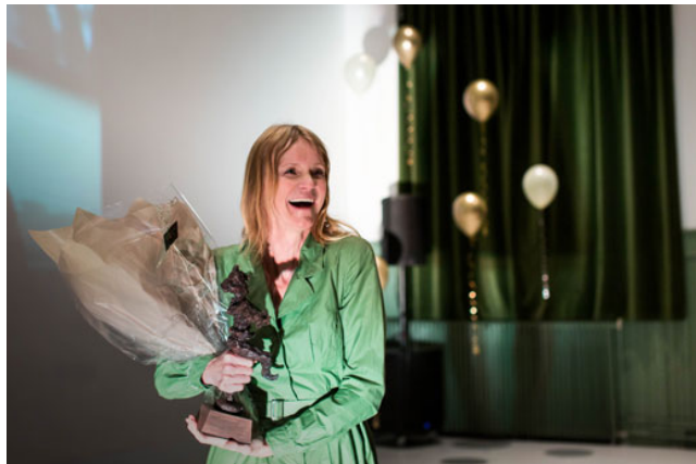
Foto fra prisutdelingen den 24. oktober 2020 på Scenehuset.