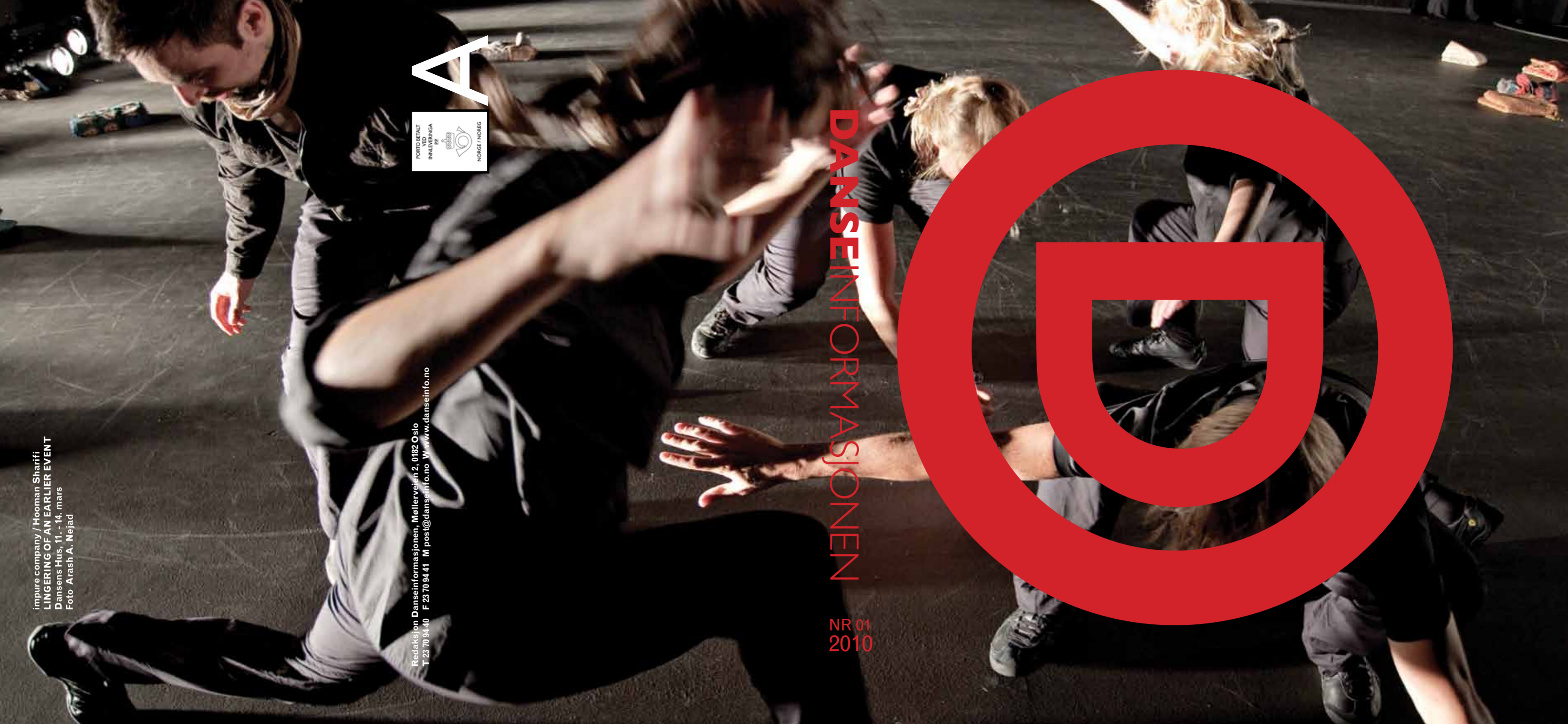
Impulscompany / Heimir Sheriffi Dance4 Oslo - AN EARLIER EVENT Dance4 Oslo 11. - 14. mars