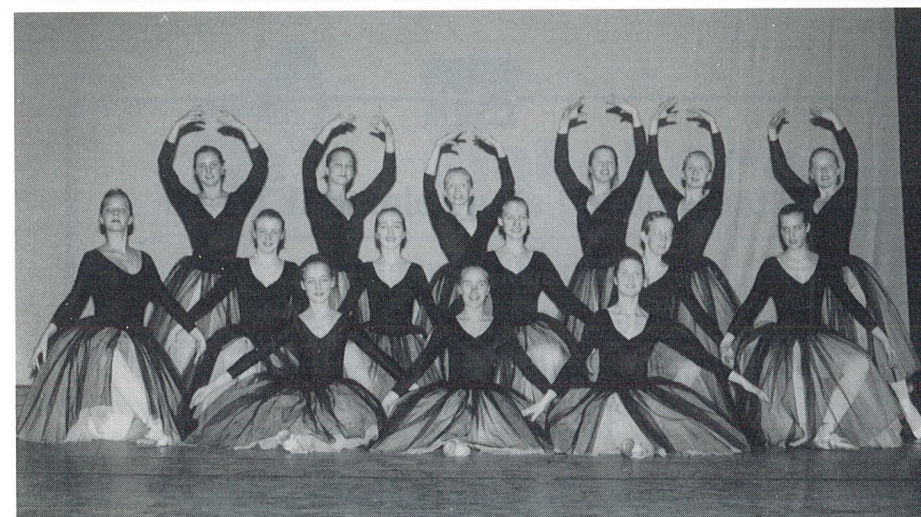
Fra The Dance Studio