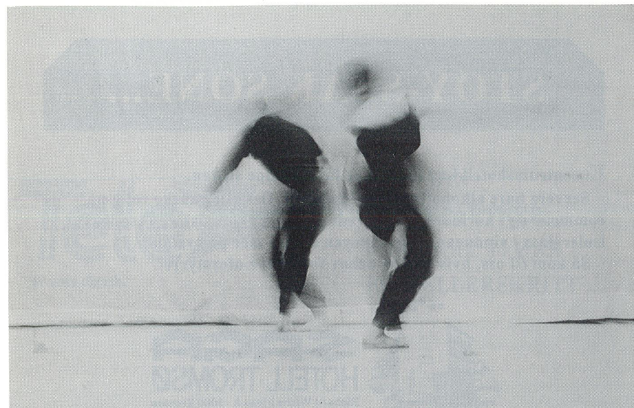
"Ut i det fri", Tromsø Danseteater