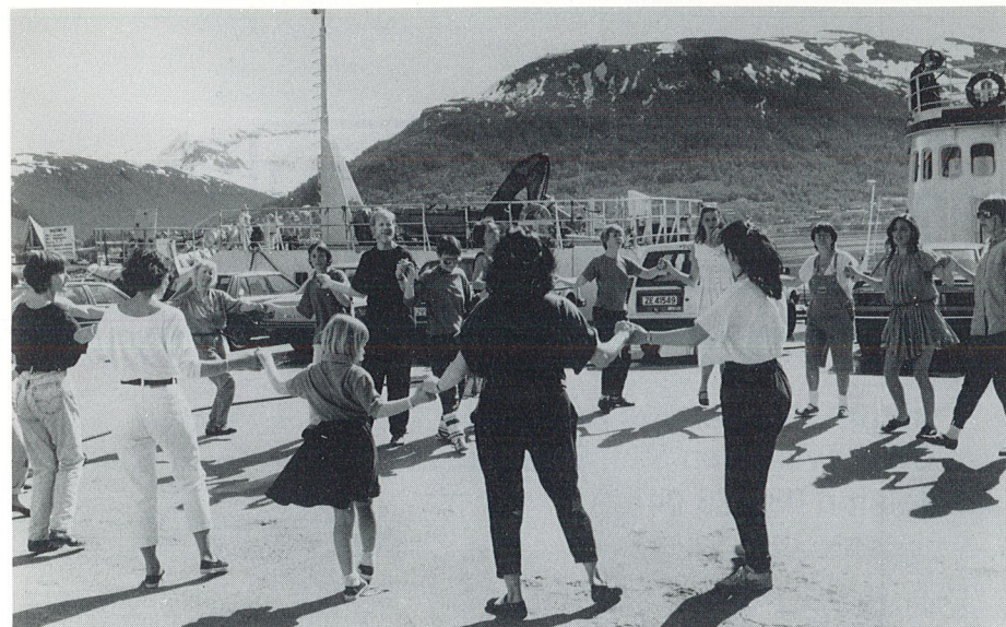
Det er den sosiale rekkedansen som preger reportuaret til Tromsø Internasjonale Folkedansklubb.