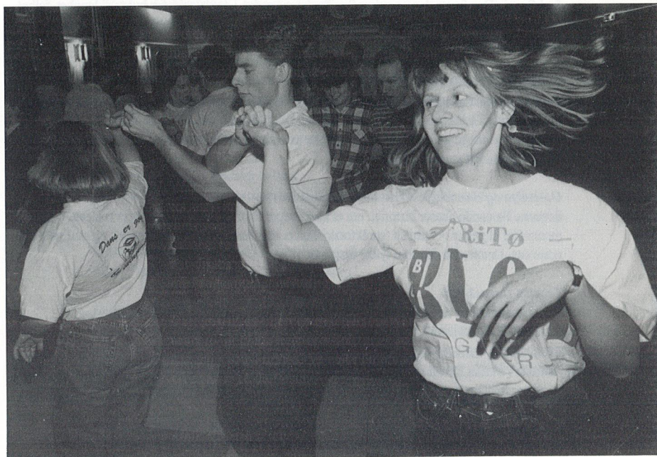
Tromsø Swingklubb